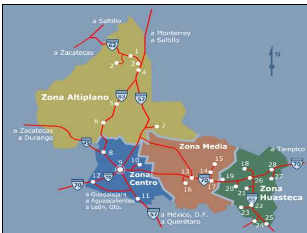
Figura 1: División de San Luis Potosí